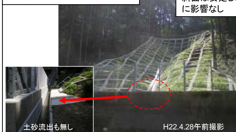
対策後(平成22年4月27日)

前回は、事前通行規制後も4時間以上全面通行止めを余儀なくされたが、今回は現道交通に影響なし