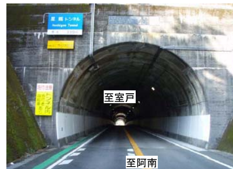
トンネル路肩にも設置