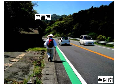
グリーンラインにより路肩部が明確に