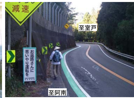
周知看板を設置しドライバーに注意を喚起