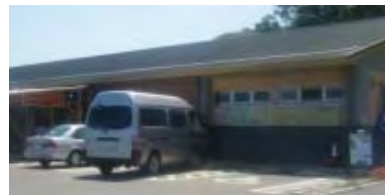
(写真) 道の駅鷹ら島

道の駅「鷹ら島」は、鷹島肥前大橋開通直前の平成21年4月17日にオープンし、魚介類や農産物等の販売を行っている道の駅です。鷹島の玄関口であり、唐津市肥前町に近接しています。