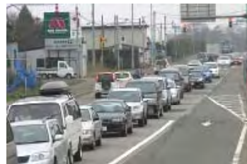
【開通前の並行現道】 (R337)