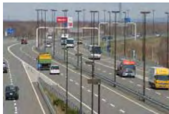
【道央圏連絡道路】 (新千歳空港関連)