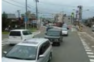
4車線化後 長生橋西詰交差点