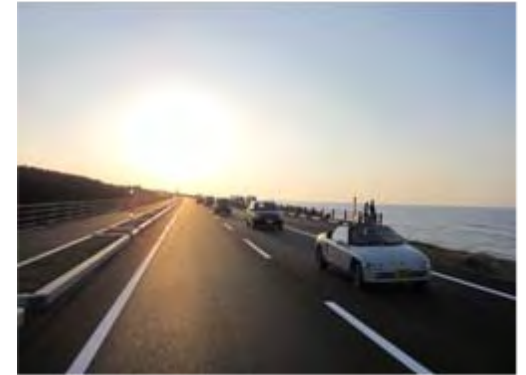
写真：開通後の新潟海岸バイパス