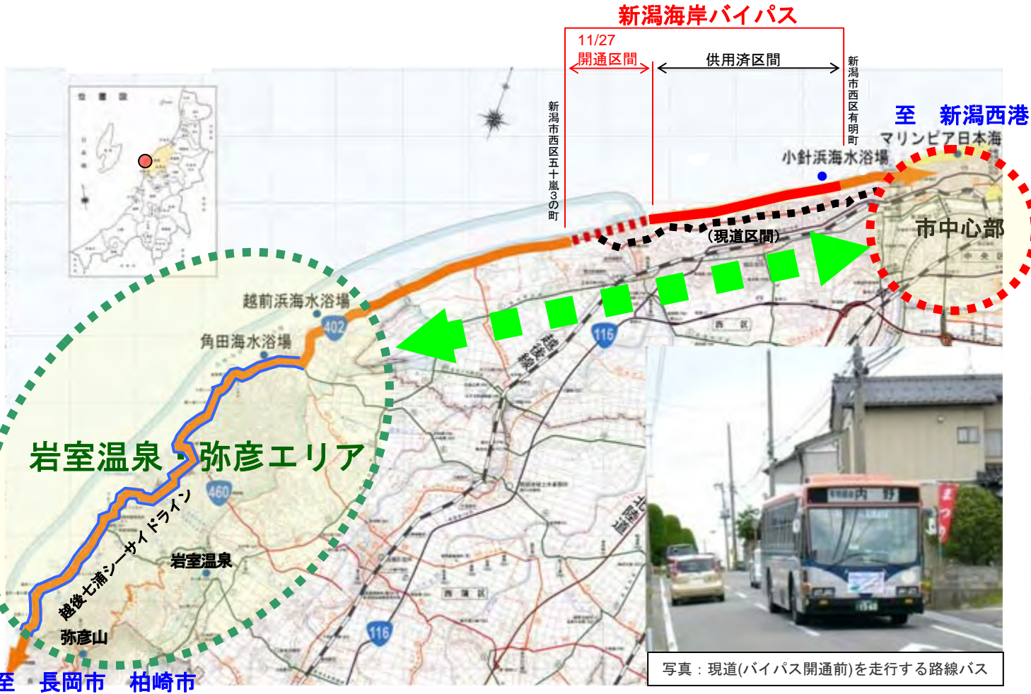
写真：現道(バイパス開通前)を走行する路線バス