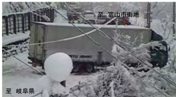
事故車により道路が閉塞 H19.3

過去5年で最大8件あった冬期登坂不能箇所を回避し、大型車のスリップによる登坂不能の解消。