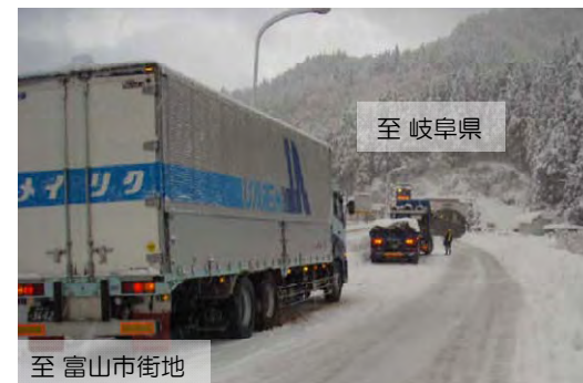
スリップ車による登坂不能車 H22.1