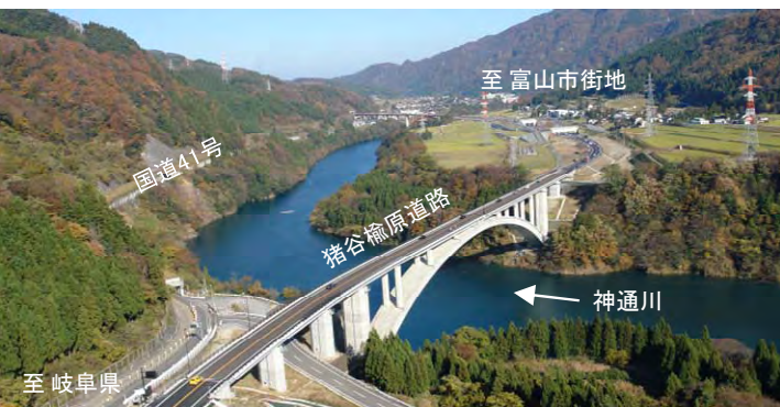
整備後の猪谷楡原道路(急峻な地形を回避)