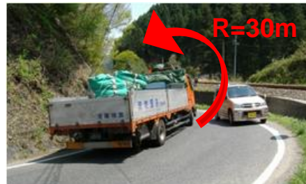
幅員が狭く、また見通しが悪い県道新見勝山線(真庭市岩井谷～月田本)