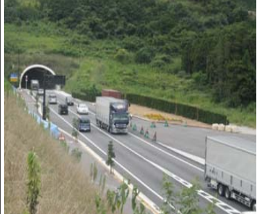
▲飯塚庄内田川バイパス

西鉄特急バス 田川・伊田に乗り入れ 福岡天神から 新トンネルで 地元が歓迎式典 県立大学などがある。田川市伊田と福岡市天神を結ぶ西鉄の特急バスが4月から運行を始め、3日、乗り入れ歓迎式典があった。国道201号・筑豊烏尾トンネル開通(3月22日)に伴う新路線で、平日は9・5往復、土日・祝日は7往復する。 伊田地区は市の中心市街地だが、特急バスの乗り入れは初めて。同地区で開かれた式典は伊田商店街振興組合(森勝治理事長)の主催で、市や商店街の関係者、県立大生ら約80人が出席。森理事長らが「乗り入れは県立大生と地域住民の長年の夢で、経済効果も大きい。福岡の人もぜひ利用してほしい」とあいさつした。式典後、参加者の一部は早速、近くの「県立大前」バス停から特急バスに乗り込んだ。 新路線は伊田から烏尾トンネルがある飯塚庄内田川バイパスを利用、八木山バイパスを経由し、天神まで約1時間20分で結ぶ。運賃は1450円。飯塚庄内田川バイパス上に鶴三緒橋、下三緒、庄内工業団地、関の台団地の4停留所が新設された。また、従来の烏尾