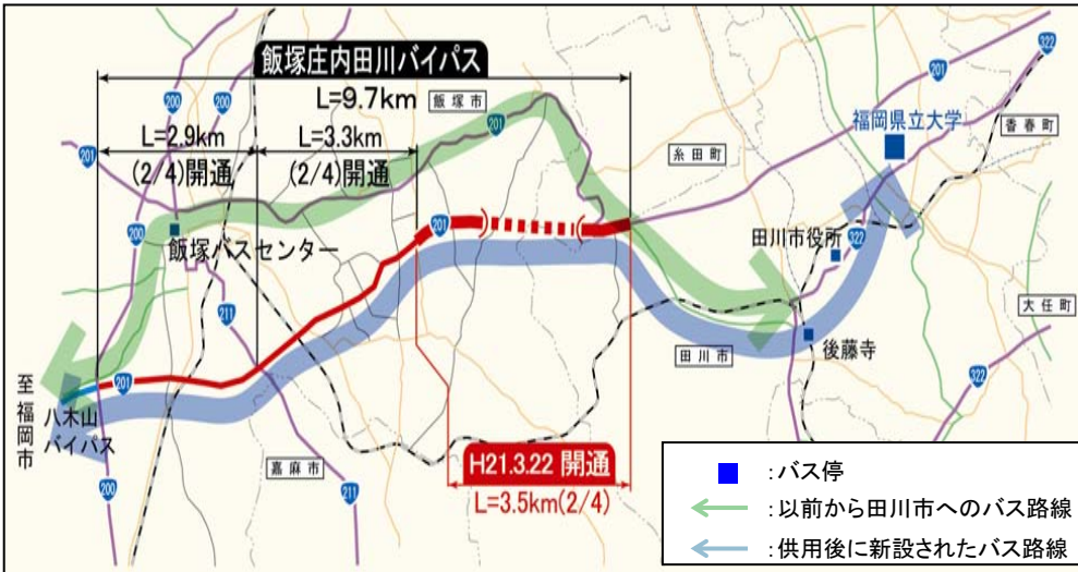
▲開通前後のバス路線の延伸状況