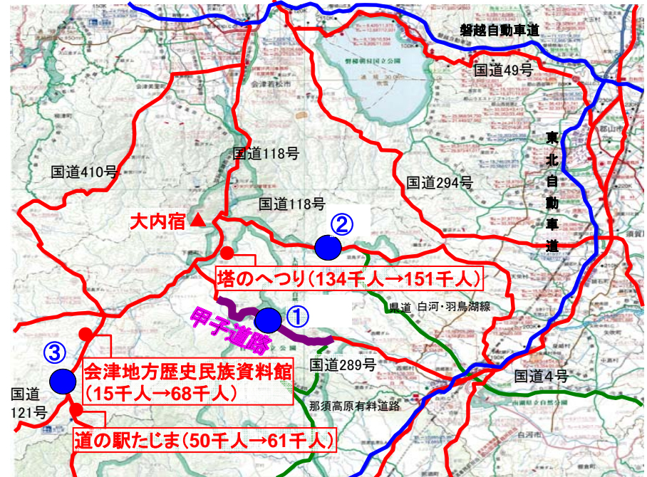
※( )書きは、平成19年10月及び平成20年10月の総入り込み客数の変化を示したものである