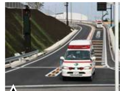
新宮南IC出口から新宮市立医療センターに向かう救急車