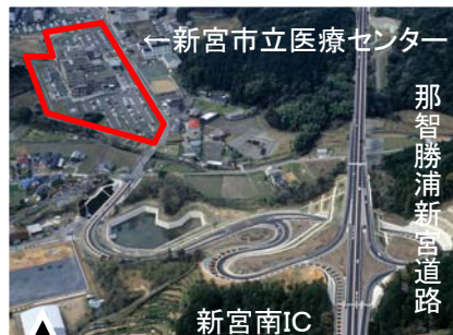
新宮南ICと直結する新宮市立医療センター付近の状況