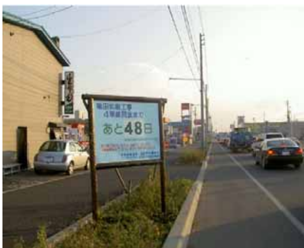
国道5号亀田拡幅事業のカウントダウン

本工事においてもカウントダウン看板を主として、事業の必要性と工事への理解していただくことを目的とする看板の設置を検討。