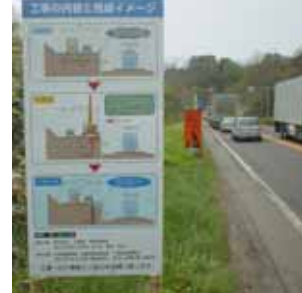
カウントダウン看板設置状況 工事の概要看板設置状況 工事の工法看板設置状況