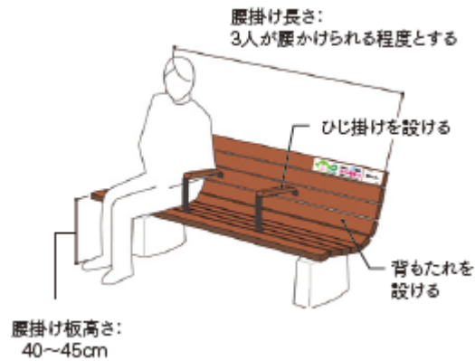
図 4-3 好ましいベンチデザイン

寄付による歩道上へのベンチ設置のほか、寄付額に応じ、寄付者名等を記載したプレートベンチに貼付する取組や地域団体に対するベンチ設置の補助を行っている。