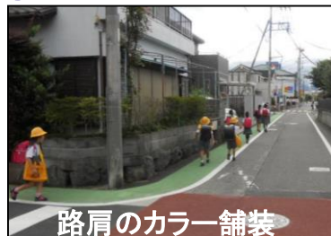
路肩のカラー舗装