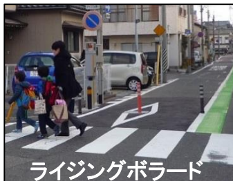
ライジングボラード