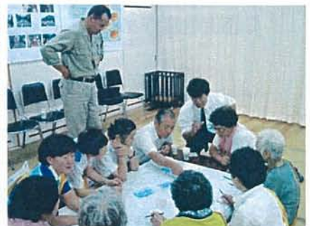
道路を歩いた後、問題点・課題をみんなで話し合いました。