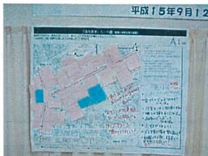
問題点・課題・解決策など、たくさんの意見が出されました。