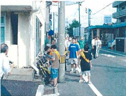
豊照小学校の児童も総合学習の一環として「みち歩き」に参加しました。

町の道路」を歩いて頂き、その後集会所「とよてる」において意見交換を行いました。その中で、 ○歩行スペースが狭い ○街灯が少なく夜間暗い ○道路がデコボコして歩きづらい ○大型車の通行を禁止してもらいたい など、様々なご意見を頂きました。詳しくは裏面をご覧ください。