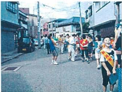
みんなで道路を歩き、問題点・課題を観察・発見しました。