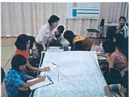
みんなで問題点・課題を地図に書き込みました。