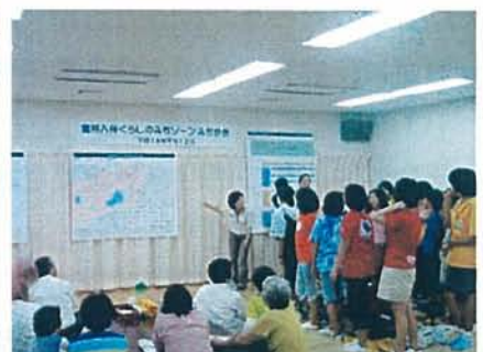
話し合った内容を、グループごとに発表し、共通認識を得ました。