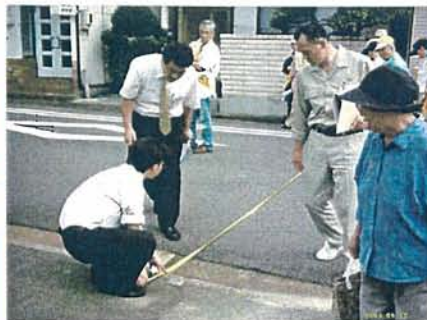
この道路の幅はどのくらいだろう？