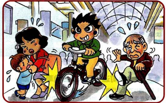
本通・金座街・えびす通りでの自転車通行は禁止されています。 (昼12時～夜8時まで)