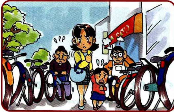
放置自転車は歩行者の障害(バリア)になっています。