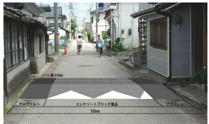
写真 ハンプ設置イメージ (長崎街道)