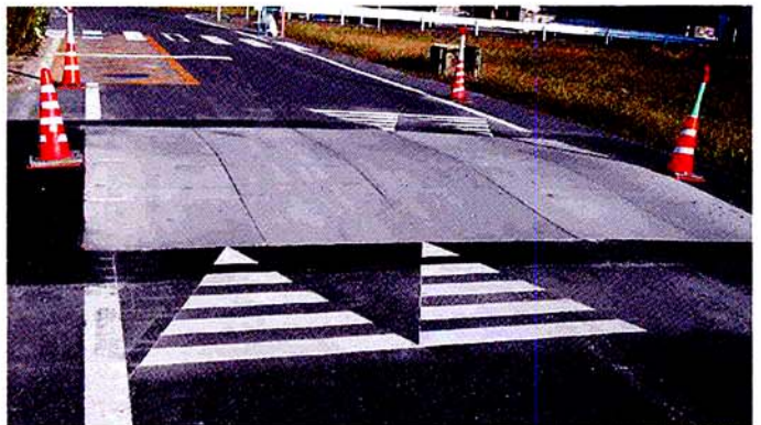
写真：コンクリート製ハンプ