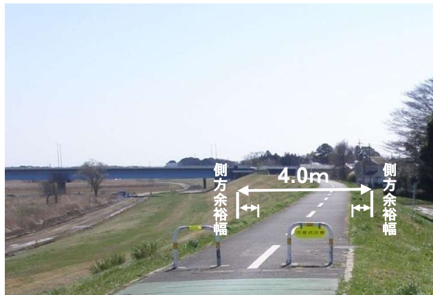
一般県道三郷幸手自転車道線(江戸川自転車道) (埼玉県春日部市)