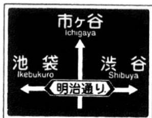
方面、方向及び道路の通称名