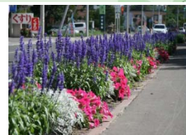
札幌芸術の森 フラワーロード