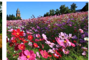
滝野すずらん 丘陵公園