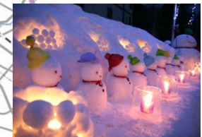
アイスキャンデル (雪あかり)