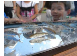
豊平川さけ科学館