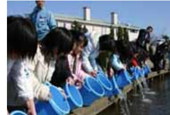
サケの遡上南限の栗山川