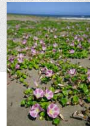
ハマヒルガオの群生地