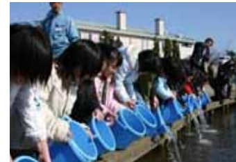
サケの遡上南限の栗山川