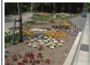
道路景観整備活動