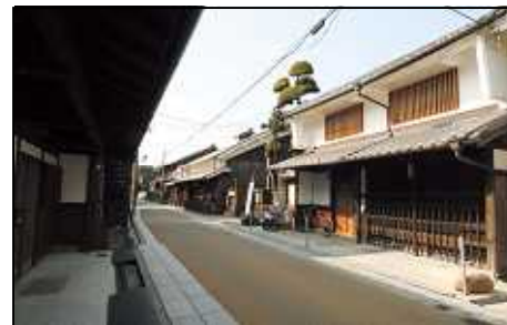
ひらかた 枚方宿の街なみ