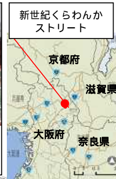
新世紀くらわんか ストリート