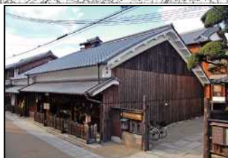
鍵屋資料館 (伏見と大坂を結ぶ三十石船の船宿として江戸時代に栄える)