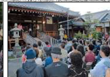
枚方宿ジャズストリート