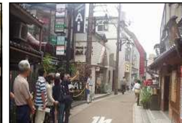
町家情報バンク部会 (建物所有者と、建物を活用したい人を結びつける仕組み)