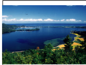
しょうてんきょう 小天橋