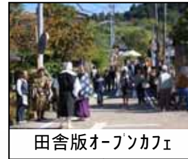
田舎版オープンカフェ