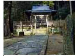
滝尻王子(熊野古道)