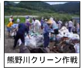
熊野川クリーン作戦