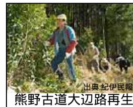
熊野古道大辺路再生