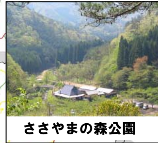
ささやまの森公園