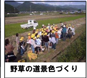
野草の道景色づくり