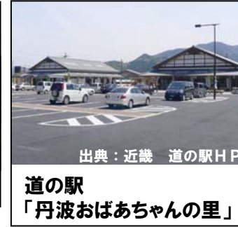
道の駅 「丹波おばあちゃんの里」