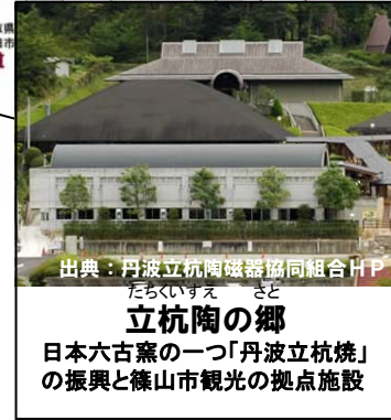
出典：丹波立杭陶磁器協同組合HP たちいすえ さと 立杭陶の郷 日本六古窯の一つ「丹波立杭焼」の振興と篠山市観光の拠点施設