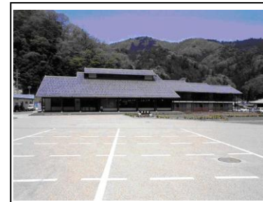
町営ホテル 流星館