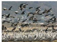
②鹿児島県のツル及びその渡来地