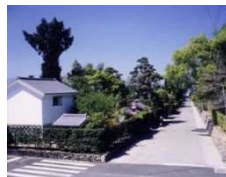
①出水市公開武家屋敷群