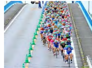
自転車イベントの開催