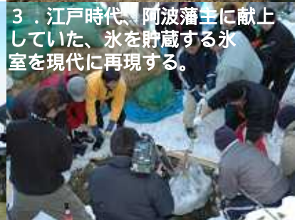
3. 江戸時代、阿波藩士に献上していた、氷を貯蔵する氷室を現代に再現する。