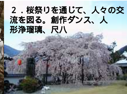
2. 桜祭りを通じて、人々の交流を図る。創作ダンス、人形浄瑠璃、尺八