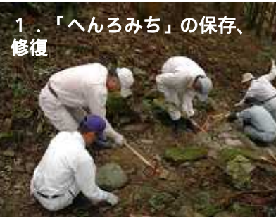
1. 「へんろみち」の保存、修復