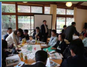
ワークショップ状況