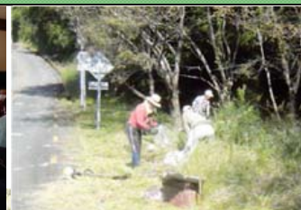
アドプト活動状況