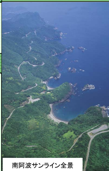
南阿波サンライン全景