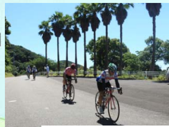
四国の右下ロードライド