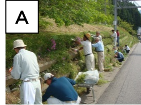
植栽手入れによる来訪者をもてなす活動(県道12号)