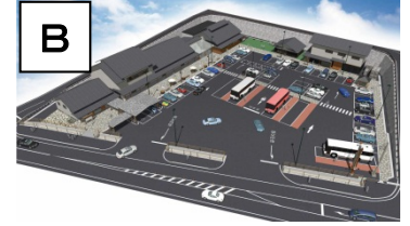
道の駅「天空の郷さんさん」(平成26年4月22日 オープン)