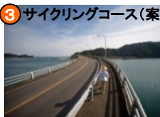
3 サイクリングコース(案) 横浪黒潮ラインに続く (主)47号線宇佐大橋