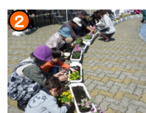
2 市街地の景観美化・植栽活動