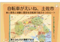
自転車がいね、土佐市 街と景色と歴史を自転車で結ぶ4つのルート 海と山と川が賞観できる 絶景スポットから知られるコーススポットまで 実は観光圏な土佐市 サイクリングコース(案)