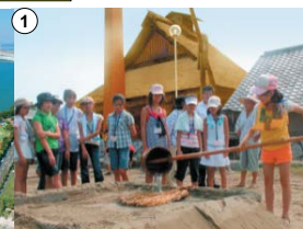
復元塩田(塩づくり体験施設)