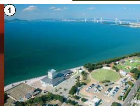
瀬戸内海と塩飽諸島 瀬戸大橋 道の駅 『恋人の聖地 うたづ臨海公園』