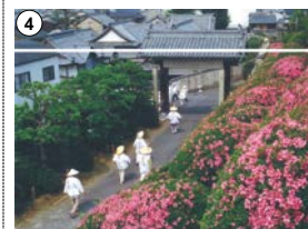
遍路文化を残す遍路道