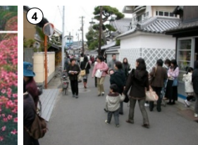
1社9か寺の古刹のある地区