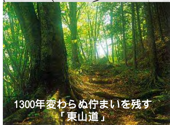
1300年変わらぬ佇まいを残す「東山道」