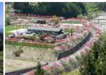
「花桃の里」住民が花桃を植樹