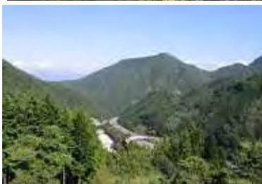
網掛山周辺の旧東山道を維持・整備