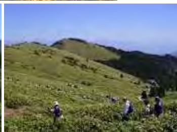
富士見台高原でのウォーキング