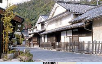
町並み保存地区 (頼惟清旧宅)