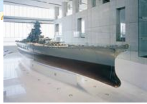
大和ミュージアム