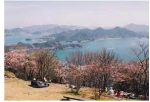
筆影山からの瀬戸の多島美