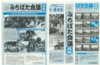
みちばた会議瓦版の発刊