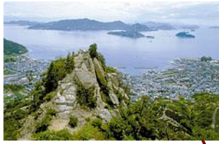
黒滝山からの眺め