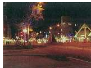
柳町通りのライトアップ