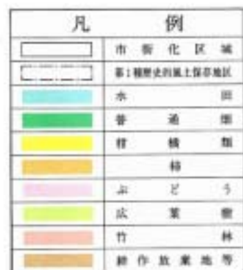
图 7-1 土地利用图