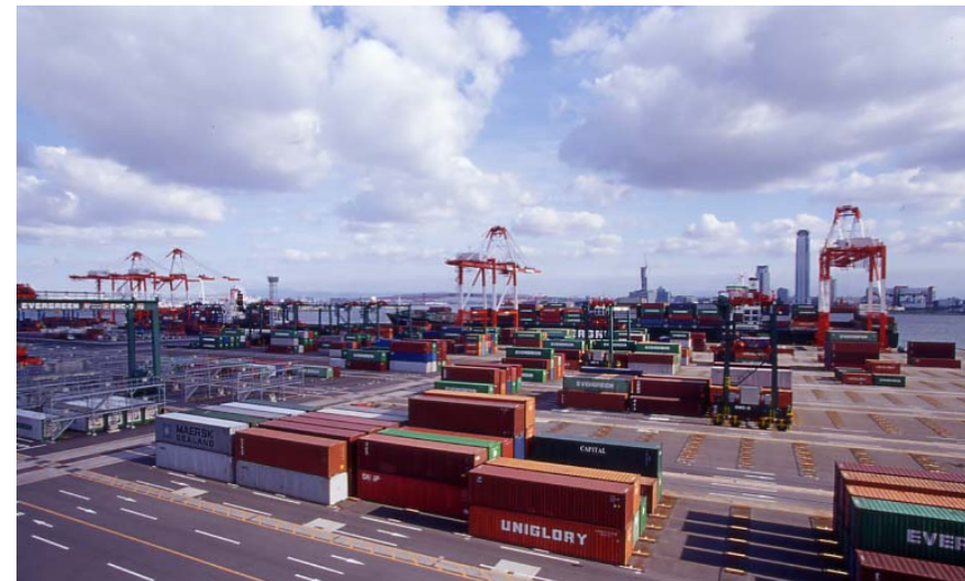
夢洲コンテナターミナル