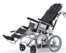
⑤座位変換型車椅子