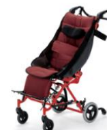
⑥子供用車椅子 (福祉バギー・バギーカー)