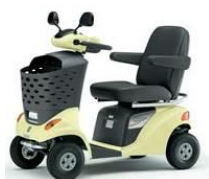
④ハンドル形電動車椅子