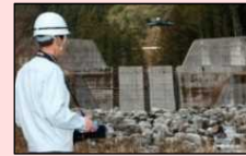
ドローンを活用した砂防関係施設点検

・地方公共団体等が適切かつ効率的なインフラメンテナンスの実施に資するため、新技術や官民連携手法の導入を促進