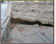
クラックが生じた河川護岸