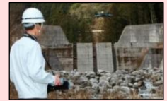
ドローンを活用した砂防関係施設点検

・地方公共団体等が適切かつ効率的なインフラメンテナンスの実施に資するため、新技術や官民連携手法の導入を促進