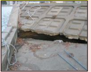
クラックが生じた河川護岸