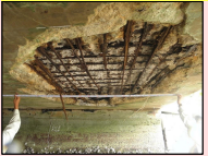
内部の鉄筋が露出した橋梁 早期に措置が必要な施設の例

・予防保全の管理水準を下回る状態となっているインフラに対して、計画的・集中的な修繕等を実施し機能を早期回復