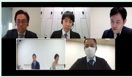
【金融部会】 都市空間×GIを考える