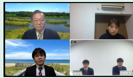
【技術部会】 防災・減災×GIを考える