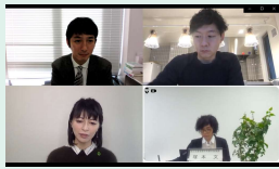
【企画・広報部会】 生活空間×GIを考える