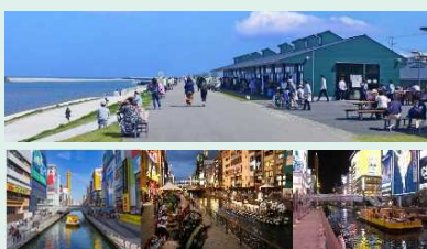
上段：かわまちてらす開上 下段：道頓堀川の水辺空間

○全国のかわまちづくりの取組の中から、他の模範となる先進的な取組を「かわまち大賞」として国土交通大臣が表彰しています。