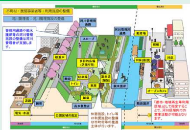
かわまちづくり支援制度のイメージ

○「かわ」の持つ地域特有の魅力を活かし「まち」と一体となってソフト・ハード支援を実施することで、水辺空間の魅力を向上させ、地域の活性化や賑わいづくりを推進する取組です。