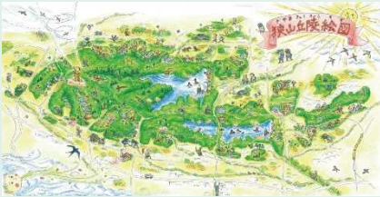
第1回グリーンインフラ大賞受賞

○公園緑地は、まちの貴重なグリーンインフラです。気候変動やコミュニティの希薄化など多様な社会課題の解決のため、地域のステークホルダーとともに公園力を高めるマネジメントを行っています。