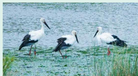
渡良瀬遊水地で採食するコウノトリ