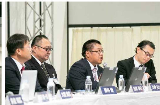
◇パネルディスカッション