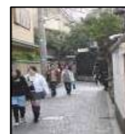
風情漂う神楽坂界隈

神楽坂は、今なお料亭の残る街。歌舞伎役者や芸術家など粋人達が愛した着物・小物・茶道具の専門店が多く集まるエリア。