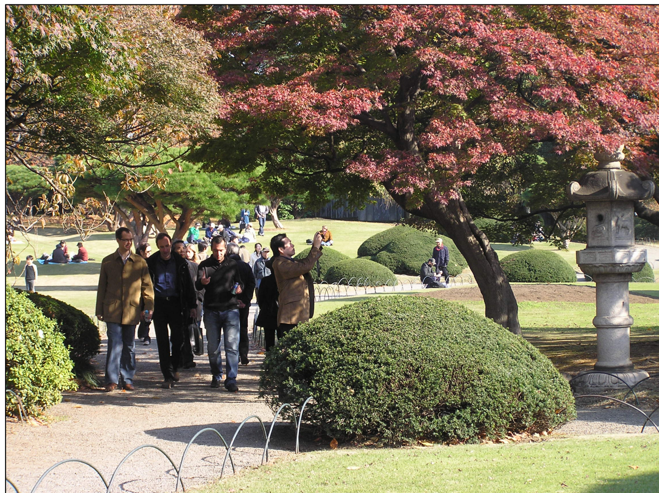
外国人旅行者に人気の新宿御苑

新宿は、東京23区内でも全宿泊者に占める外国人宿泊者数が35パーセントを超す一大宿泊拠点。都内及び周辺観光地へのアクセスも便利。また、日本有数の繁華街でのショッピングや公園での散策を楽しめ、歴史・文化にも触れられる街。JNTOの訪問地調査では、訪問率が過去9年連続トップ。