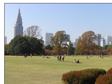
新宿御苑のイギリス風景式庭園

東京都は、東京を訪れる外国人旅行者のニーズに対応し利便性を図るため、東京都観光ボランティアを募集し「おもてなしの心」の一環としてガイドサービスを実施。都庁舎内を外国語(英・中・韓)で案内するとともに、飲食店、デパート、劇場が立ち並ぶ、日本有数の繁華街である新宿の街や都内でもまれにみる植物の多さを誇る新宿御苑、風情ある神楽坂を、7言語(英、中、韓、独、仏、伊、西)で観光案内している。