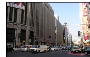
大手デパートが建ち並ぶ新宿三丁目

小田急新宿駅では、東アジア地域からの観光客を歓迎して「2007 新宿テラスシティ春節遊客キャンペーン」を実施。