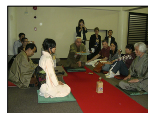
外国人の投扇興体験

神楽坂エリアでは、「神楽坂まちづくりの会」が開催する遊び心に満ちた「粋」の世界を地域ガイドが案内。また、お座敷遊びの「投扇興」などの体験イベントも実施。