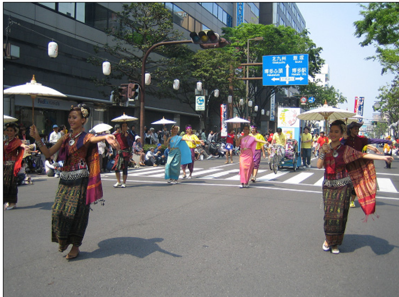
タイ国からどんたく祭りに参加

九州観光の玄関口。交通の利便性、グルメや買い物の魅力を海外にPR。外国人向け割引や受入環境の整備の充実。宿泊客数483万人のうち46万人は外国人。