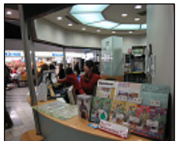
JR博多駅構内観光案内所にもフクオカ ナウ