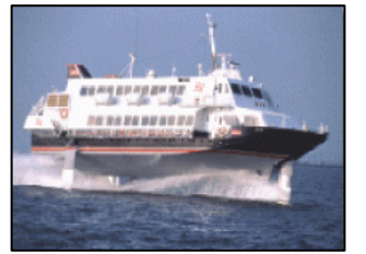
3時間弱で韓国に到着するジェットfoil

福岡空港にはアジアの主要都市(9カ国・地域)から週178便が就航している(平成19年11月現在)。また、博多港からジェットfoilで韓国の釜山市まで3時間弱で結ぶ。