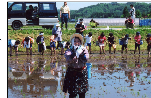
農業体験の田植え

グリーンツーリズムも県内各地の農家と連携して行っており、30年以上の実績を誇る。