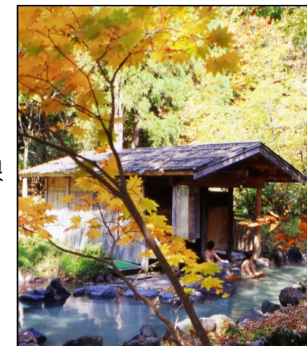
紅葉の乳頭温泉郷

平成20年からは夏のブナ林散策などを新たに追加し、約30の散策プログラムを計画している。